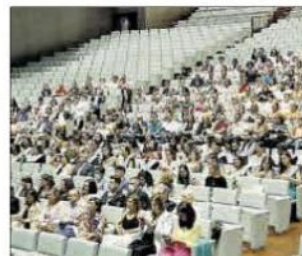
Acto de graduación.