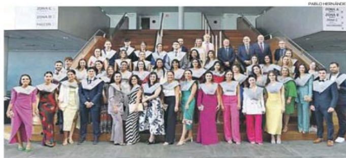
El acto contó con la presencia de familiares, profesores y autoridades en el Auditorio de Belramar.