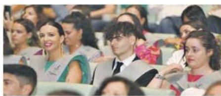
Los estudiantes recogieron sus diplomas en el acto de graduación.

Ribera Povisa prevé contratar a unas 150 personas en las próximas semanas para reforzar la plantilla durante el verano, entre ellos médicos, enfermeras, rehabilitadores, técnicos, auxiliares, camareras, limpiadoras y personal de administración y mantenimiento.