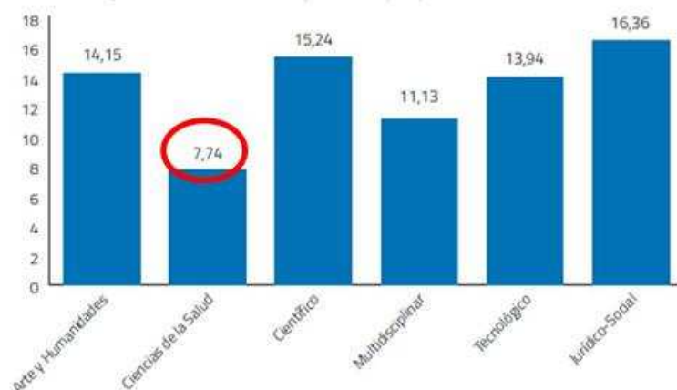
Gráfica 1. Tempo medio (en meses) necesario para atopar emprego por ámbitos académicos.

momento, dispónhase de ningún outro estudo realizado cos egresados/ as. Segundo os datos extraídos deste último estudo mencionado, chégase ás seguintes conclusións: