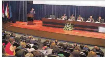
Las autoridades y profesionales asistentes al acto.